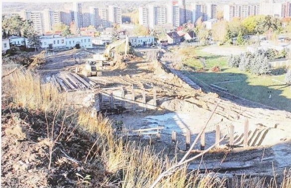
Hier neben der alten Bergstraße entsteht die Brücke für die künftige Trasse der Ortsumgehungsstraße.

Für die Neubrandenburger war die 300-jährige Stieleiche ein langes Streit- und Gesprächsthema. Wie das wohl ausging!? Ein besonders seltenes Ereignis war vor der Freigabe für den Straßenverkehr das große Sportfest auf der Umgehungsstraße. Wir freuen uns über ihr Kommen. Die Filmfreunde erleben dabei die Straßenbautätigkeit bis zur fertigen Umgehungsstraße.